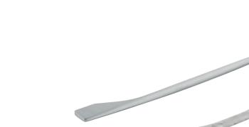
cod.1400 maniglia cromata chrome handle cod.1399 maniglia cromata chrome handle interasse 320 mm interasse 160 mm (su ante minori o uguali a 40cm) шаг 320 mm шаг 160 mm (на дверках, равных или менее 40 см) step 320 mm step 160 mm (on doors 40cm or smaller)