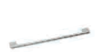
cod.350A maniglia cromata chrome handle interasse 256 mm шаг 256 mm step 256 mm