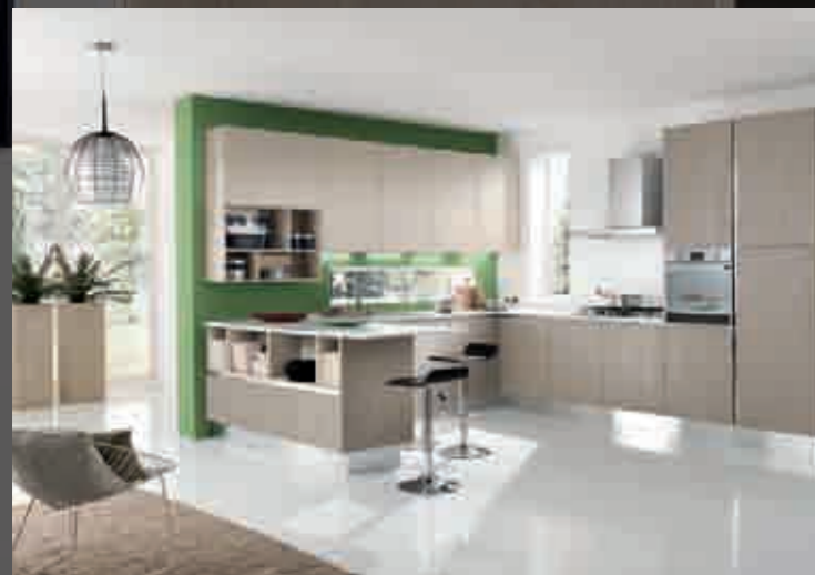
pag.14 visone/mandorla - норка/миндаль - mink/almond