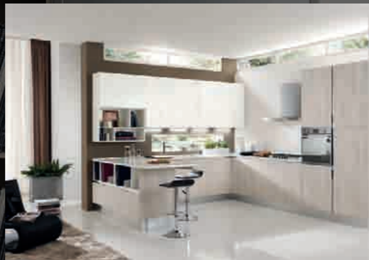
pag.18 silice/bianco - кремнезем/белый - silica/white