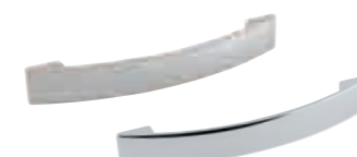
cod.303AB maniglia satinata / cromata satin / chrome handle interasse 160 mm шаг 160 mm step 160 mm

Chipboard with FSC certification, material derived exclusively from crops, veneered with high resistance impregnated paper pure melamine, squared finishing "vena registro Yosemite" wood effect, edge in ABS with polyurethane water and heat resistant glues.