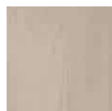
argilla глина clay