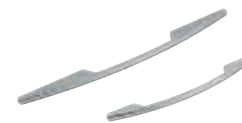
cod.NXA maniglia cromata chrome handle interasse 160 mm шаг 160 mm step 160 mm L. 235/350 mm

maniglie vari modelli in metallo con finitura galvanica cromata o satinata. различные модели ручек из металла с гальваническим блестящим и матовым покрытием. various models of metal handles with galvanic chrome-plated and satin finish.