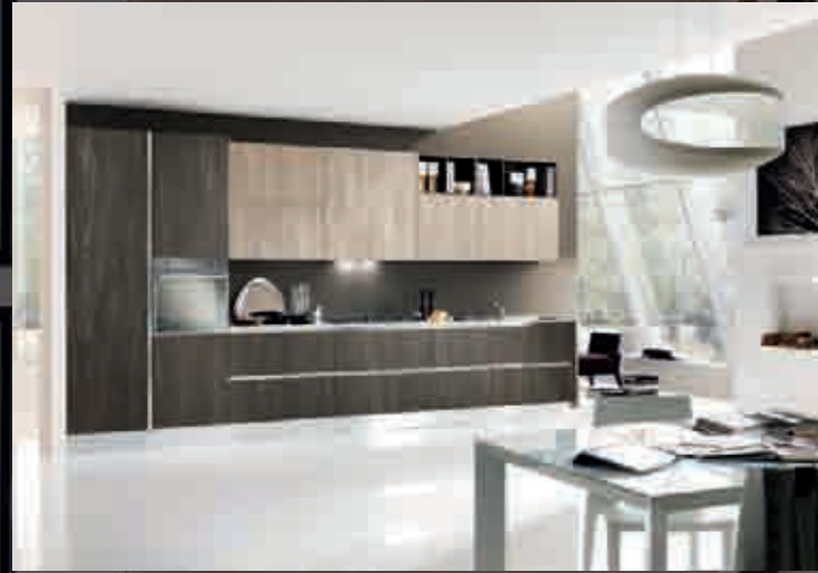
pag.2 lava/argilla - лава/глина - lava/clay