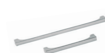
cod.1427 maniglia cromata chrome handle interasse 320 mm interasse 160 mm (su ante minori o uguali a 40cm) шаг 320 mm шаг 160 mm (на дверках, равных или менее 40 см) step 320 mm step 160 mm (on doors 40cm or smaller)