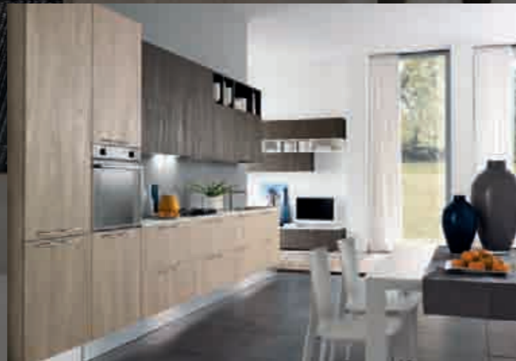
pag.32 lava/argilla - лава/глина - lava/clay