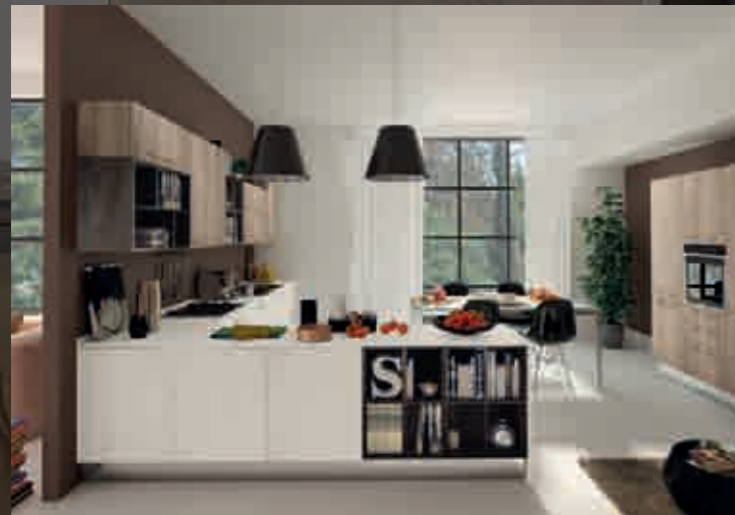
pag.22 bianco/argilla - белый/глина - white/clay