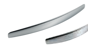
cod.1158 maniglia cromata chrome handle interasse 320 mm interasse 160 mm (su ante minori o uguali a 40cm) шаг 320 mm шаг 160 mm (на дверках, равных или менее 40 см) step 320 mm step 160 mm (on doors 40cm or smaller)