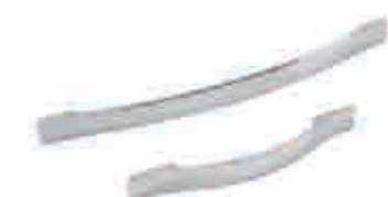
cod.10323 maniglia cromata chrome handle interasse 320 mm interasse 160 mm (su ante minori o uguali a 40cm) шаг 320 mm шаг 160 mm (на дверках, равных или менее 40 см) step 320 mm step 160 mm (on doors 40cm or smaller)