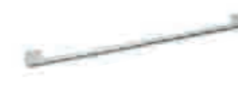
cod.350B maniglia cromata chrome handle interasse 320 mm interasse 160 mm (su ante minori o uguali a 40cm) шаг 320 mm шаг 160 mm (на дверках, равных или менее 40 см) step 320 mm step 160 mm (on doors 40cm or smaller)