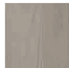
visone норка mink

Pannello truciolare con certificazione FSC, materiale proveniente esclusivamente da coltivazioni, nobilitato con carte impregnate pura melamina ad altissima resistenza, squadrato finitura vena registro Yosemite, effetto legno bordato ABS a spessore con collanti poliuretanicci ad altissima resistenza ad acqua e calore.