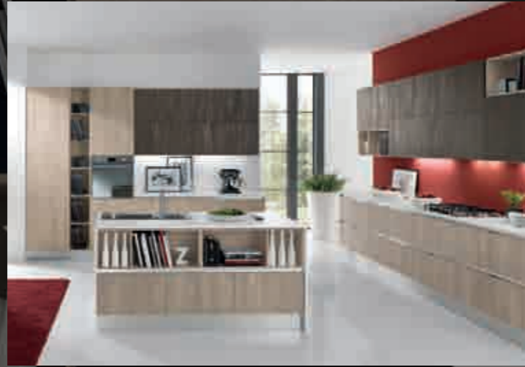
pag.8 argilla/lava - глина/лава - clay/lava