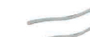
cod.1110 maniglia cromata chrome handle interasse 320 mm interasse 160 mm (su ante minori o uguali a 40cm) шаг 320 mm шаг 160 mm (на дверках, равных или менее 40 см) step 320 mm step 160 mm (on doors 40cm or smaller)